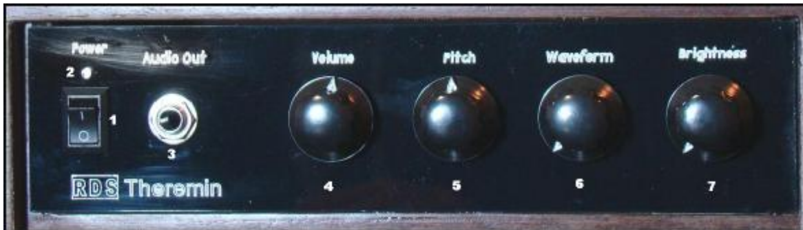
Painel frontal do RDS Theremin.