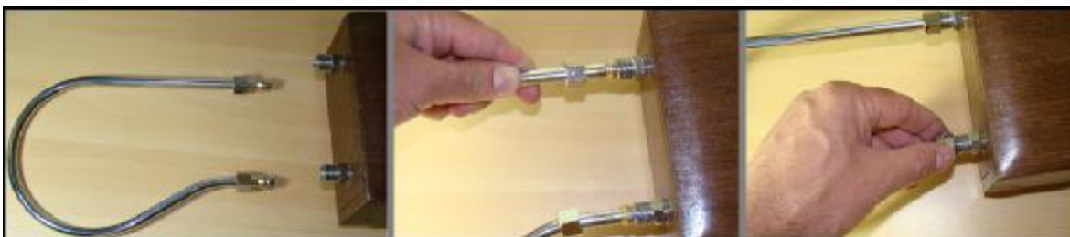
Fig.1 - Instalando a antena de Volume.

Antes de ligar seu RDS Theremin será necessário instalar as antenas. Comece pela antena de Volume. Encaixe-a no lugar e aperte as duas porcas com as mãos sem fazer muita força, apenas o suficiente para firmá-la no lugar (Figura 1). Não é necessário qualquer tipo de ferramenta para isto, use apenas suas mãos. Caso queira retirá-las apenas desenrosque as duas porcas.