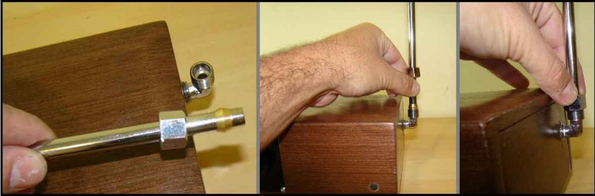
Fig.2 - Instalando a antena de Tom. Verifique antes de apertar se esta corretamente na vertical.

Repare que nas duas antenas as porcas e os olhais estão presos a elas e não devem ser retirados.